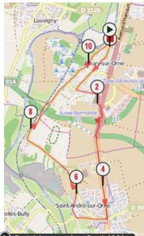
Circuit de la course en ligne - Tour de 10.8 kms

15h45 | Place Jean Jaurès Course en ligne (Tour de 10.8 kms) 2 ème départ