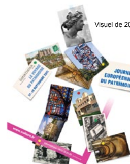
Visuel de 2011

Randonnée découverte dans le vieux Fleury - départ à 9h30, Grande Rue au niveau de l'allée des peupliers - durée du circuit : environ 2h30.