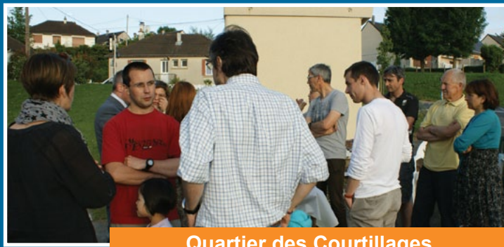
Quartier des Courtilages