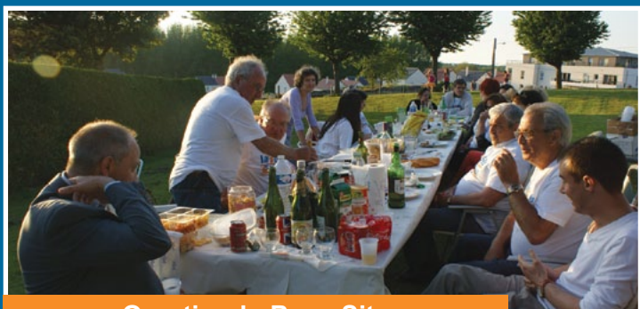
Quartier du Beau Site