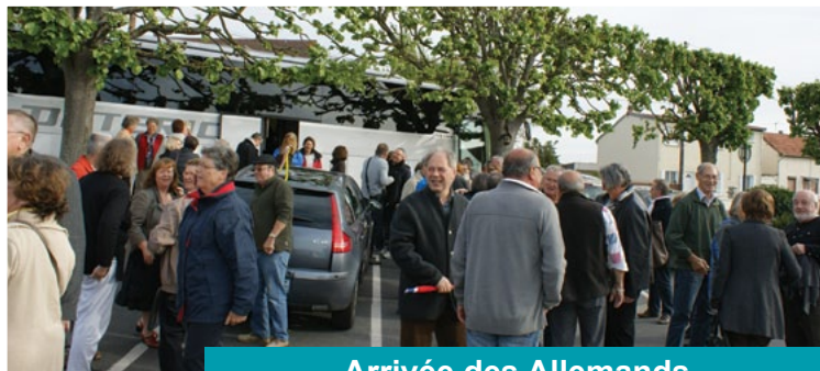
Arrivée des Allemands