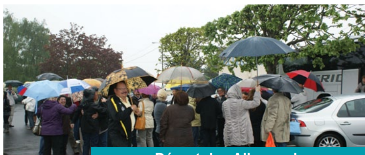
Départ des Allemands