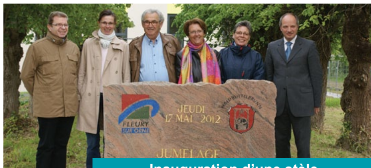
Inauguration d'une stèle