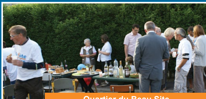
Quartier du Beau Site