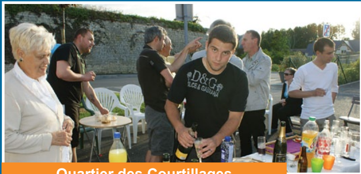
Quartier des Courtilages