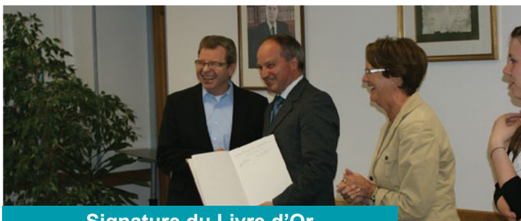
Signature du Livre d'Or