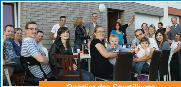
Quartier des Courtilages