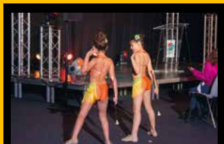
Démonstration de Twirling Bâton