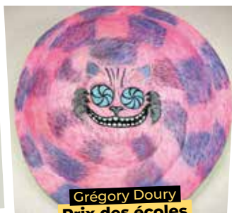
Grégory Doury Prix des écoles