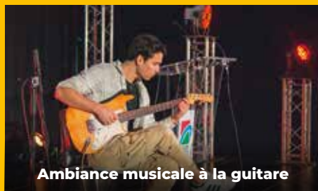
Ambiance musicale à la guitare