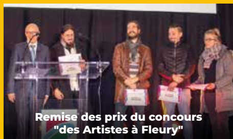
Remise des prix du concours "des Artistes à Fleury"

Cérémonie des vœux du maire à la population . 11/01/2024