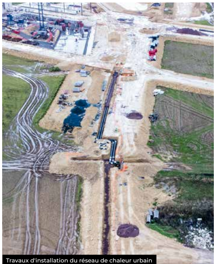
Travaux d'installation du réseau de chaleur urbain

Des travaux sont en cours pour prolonger ce réseau sur l'ensemble de l'espace économique Normandika . De nouveaux développements seront réalisés dans les mois et les années qui viennent. C'est l'assurance de prix plus stables que ceux du gaz ou de l'électricité.