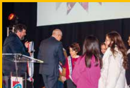
Remise des écharpes aux membres du nouveaux Conseil Municipal des Jeunes