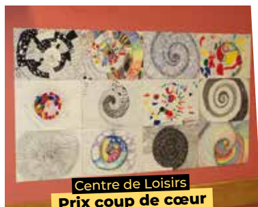
Centre de Loisirs Prix coup de cœur des artistes