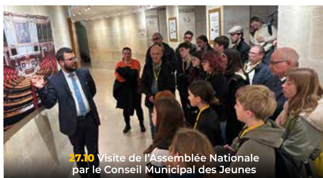
27.10 Visite de l'Assemblée Nationale par le Conseil Municipal des Jeunes