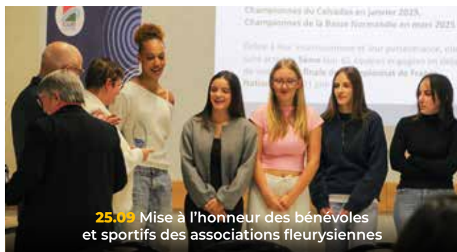
25.09 Mise à l'honneur des bénévoles et sportifs des associations fleurysiennes