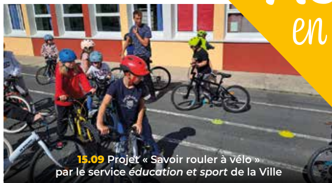
15.09 Projet « Savoir rouler à vélo » par le service éducation et sport de la Ville