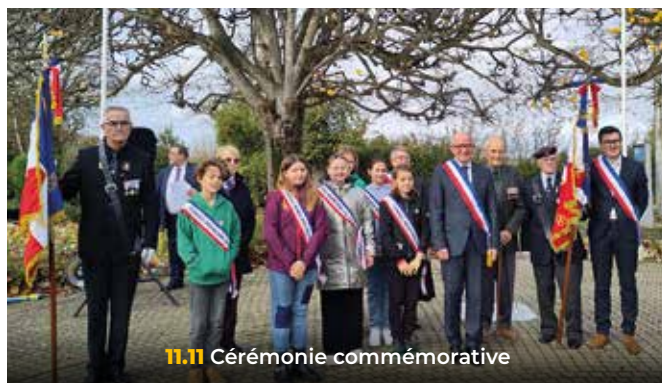
11.11 Cérémonie commémorative