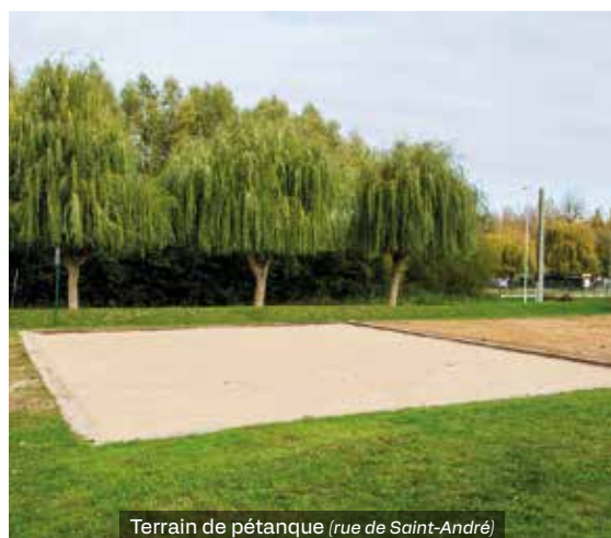
Terrain de pétanque (rue de Saint-André)