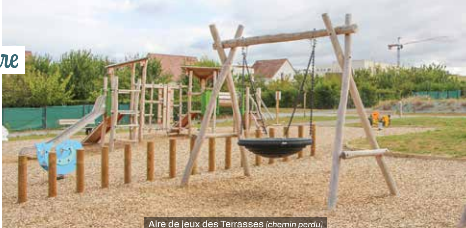
Aire de jeux des Terrasses (chemin perdu)

Fruit d'une collaboration entre FONCIM, la Ville et des entreprises locales, cette aire de jeux illustre notre volonté commune de promouvoir des projets durables tout en soutenant l'économie du territoire.