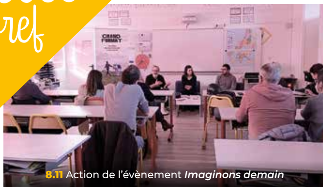
8.11 Action de l'évènement Imaginons demain