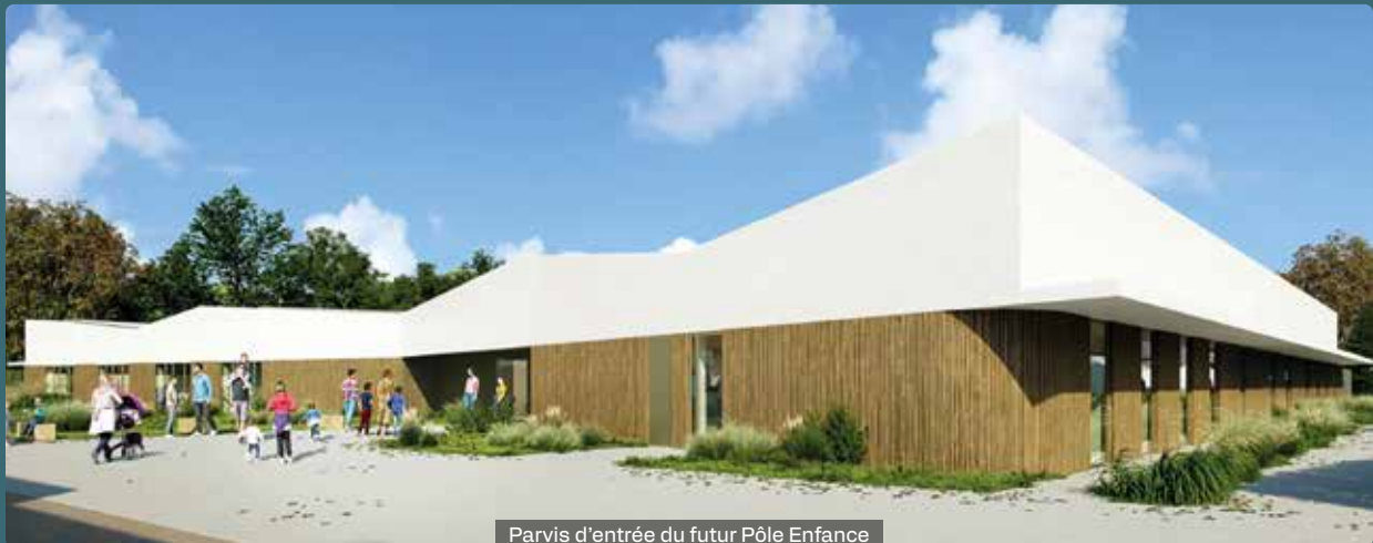
Parvis d'entrée du futur Pôle Enfance

L'ambition de ce projet est claire : accompagner les enfants de la petite enfance à l'entrée au collège, aux côtés de leurs parents, et créer un lieu ressource, fédérateur et ouvert à toutes les familles.