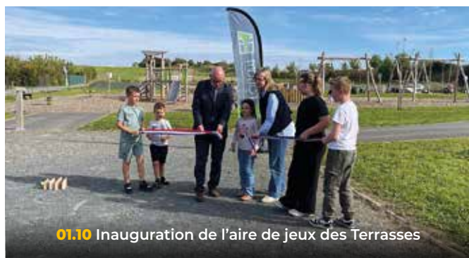
01.10 Inauguration de l'aire de jeux des Terrasses