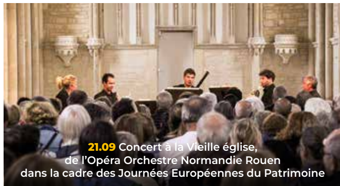
21.09 Concert à la Vieille église, de l'Opéra Orchestre Normandie Rouen dans la cadre des Journées Européennes du Patrimoine