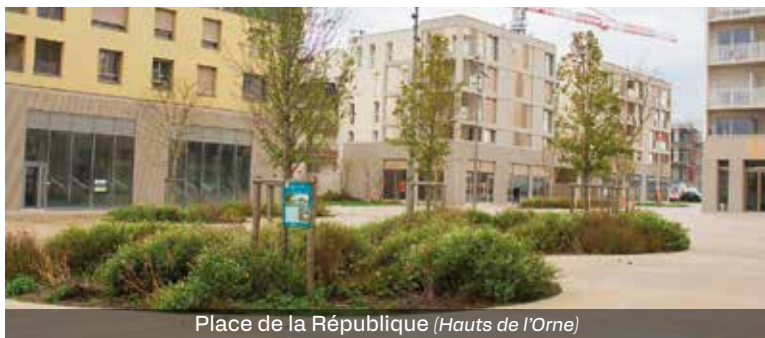
Place de la République (Hauts de l'Orne)

Dans le cadre de l'amélioration du cadre de vie et de la valorisation des espaces publics, le quartier des Hauts de l'Orne bénéficiera prochainement de l'installation de nouveaux éléments de mobilier urbain.