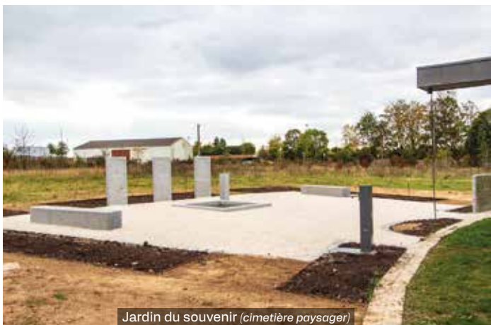
Jardin du souvenir (cimetière paysager)