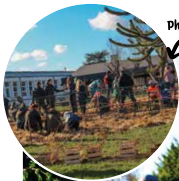
Début du projet, Phase de plantation en janvier