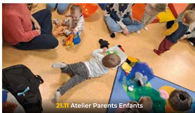
21.11 Atelier Parents Enfants