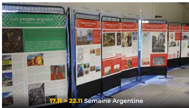
17.11 > 22.11 Semaine Argentine