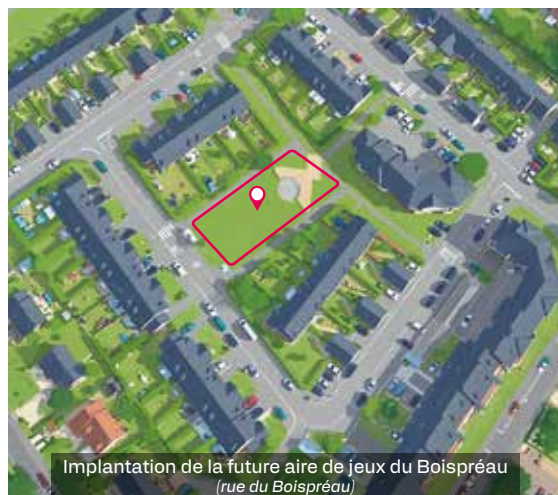
Implantation de la future aire de jeux du Boispréau (rue du Boispréau)

Les amateurs de pétanque seront heureux de découvrir ce nouveau terrain de pétanque aménagé rue de Saint-André, juste à côté du City Stade.