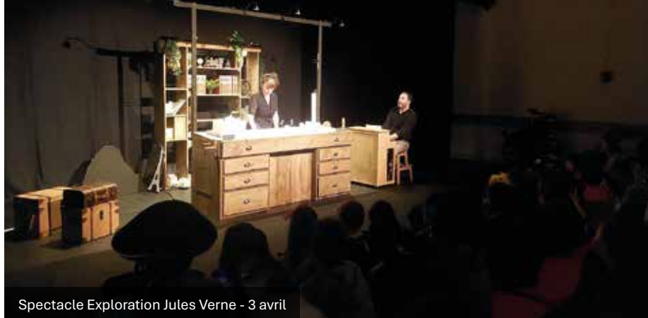
Spectacle Exploration Jules Verne - 3 avril

Tout en voulant agir avec tous les habitants intéressés, nous porterons toujours le souci d'accueillir des artistes et de bien les accueillir, de valoriser divers lieux de la commune comme la veille église, de prévoir une grande variété d'événements pour répondre à des attentes multiples et