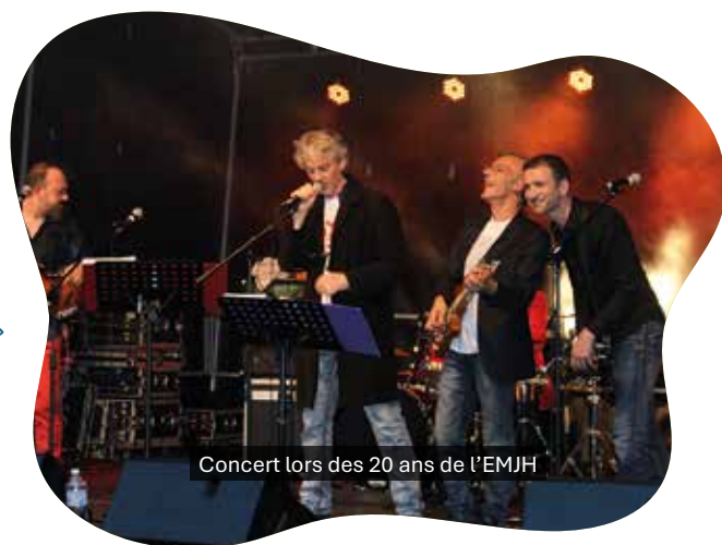
Concert lors des 20 ans de l'EMJH