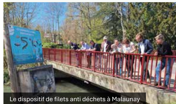
Le dispositif de filets anti déchets à Malaunay

Ce déplacement s'inscrit dans le cadre de l'offre DDTour : des visites guidées de sites inspirants organisées par l'Agence Normande de la Biodiversité et du Développement Durable (ANBDD).